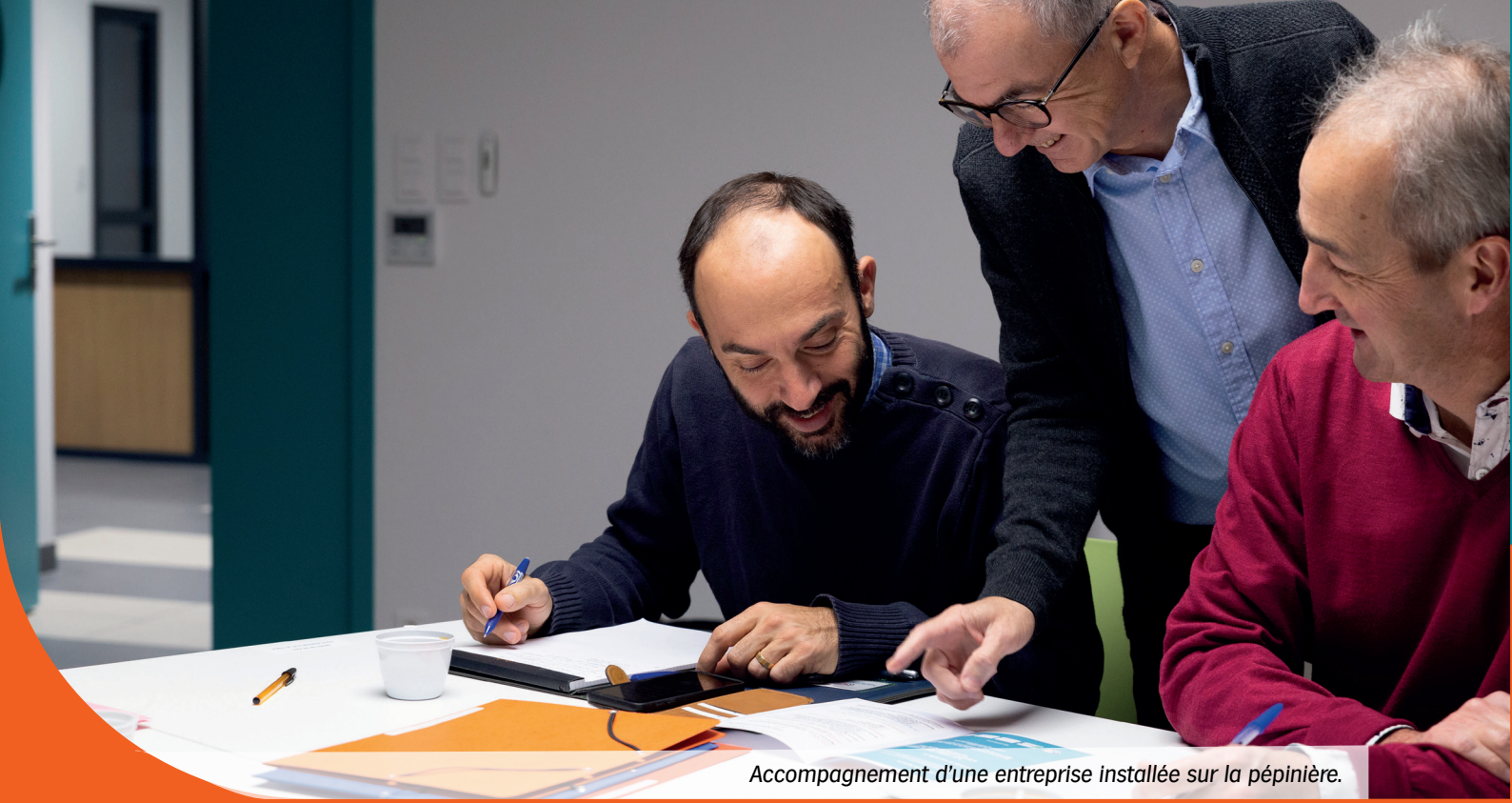
Accompagnement d'une entreprise installée sur la pépinière.